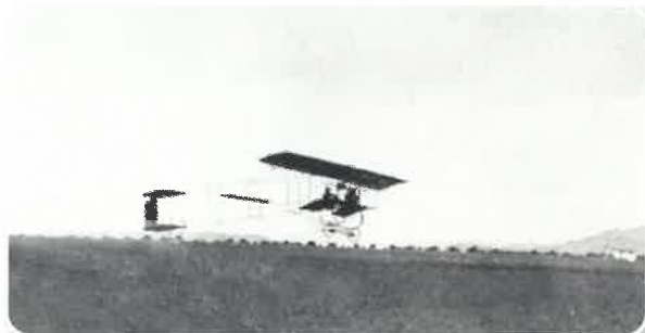
Brata Rusjan sta izdelovala dvokrilna letala, le Eda II je bila trokrilna.

Z bratom sta se takoj lotila izdelave letala, ki sta ga poimenovala Eda I . Z njo je Edvard 25. novembra 1909 opravil več krajših poletov, najdaljši med njimi je bil 60 metrov na višini človeka . Nekaj dni za tem je bil polet že na 12 m višine z razdaljo 600 metrov . Pri vzletu 6. decembra se je z Edo I zaletel v kočijo, pri čemer se je letalo razbilo, pilotu pa na srečo ni bilo hudega. Imela sta izjemno podporo domačega in tujega okolja, tako finančno kot druge oblike pomoči.