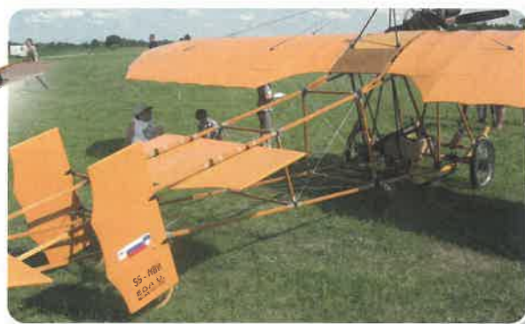
Replika Rusjanovega letala Eda V