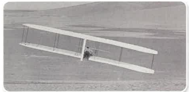
Wilbur Wright leta 1902 med treningom zavijanja z jadralnim letalom

Pionirjem letalstva jadralna letala niso več zadoščala, zato so začeli razmišljati o motornem letalu . Zasnovano in izdelavo prvega letala ter prvi nadzorovan polet z motorno napravo pripisujemo bratoma Wright . 7. decembra 1903 sta na letališču v mestu Kitty Hawk v Severni Karolini prvič poletela s svojim letalom .