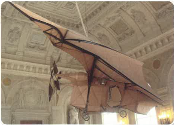
Clementovo letalo Avion III je razstavljeno v muzeju v Parizu.

Najverjetneje je prvo letalo, ki je letelo, izdelal francoski inženir ter častnik Clement Ader. Letalo je bilo podobno netopirju, poganjal ga je parni stroj in imelo je propeler s štirimi kraki.