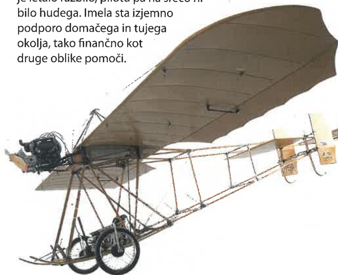
Replika letala Eda V je na ogled v Eda centru v Novi Gorici.